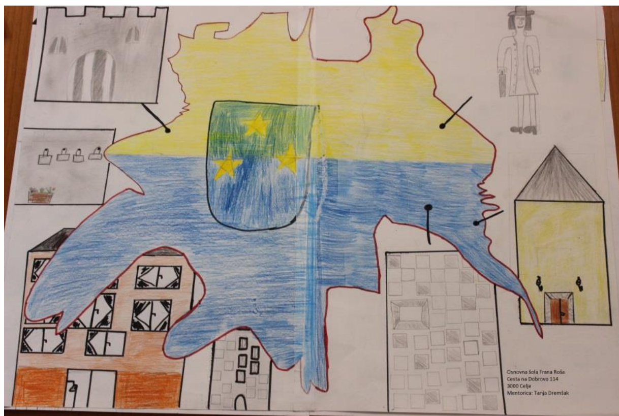
Plakat o Celju (izdelali učenci 4. a)