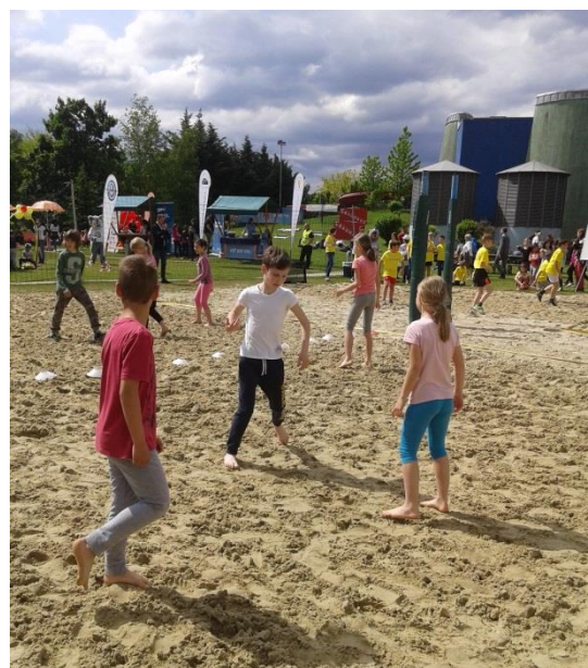
Učenci so se preizkusili v različnih igrah.

Tudi adrenalinski park je bil zelo zanimiv.