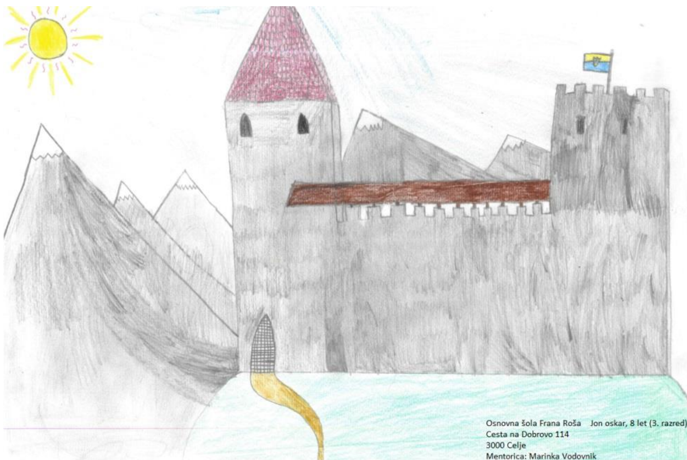
Celjski grad (narisal Jon Oskar, 3. b)