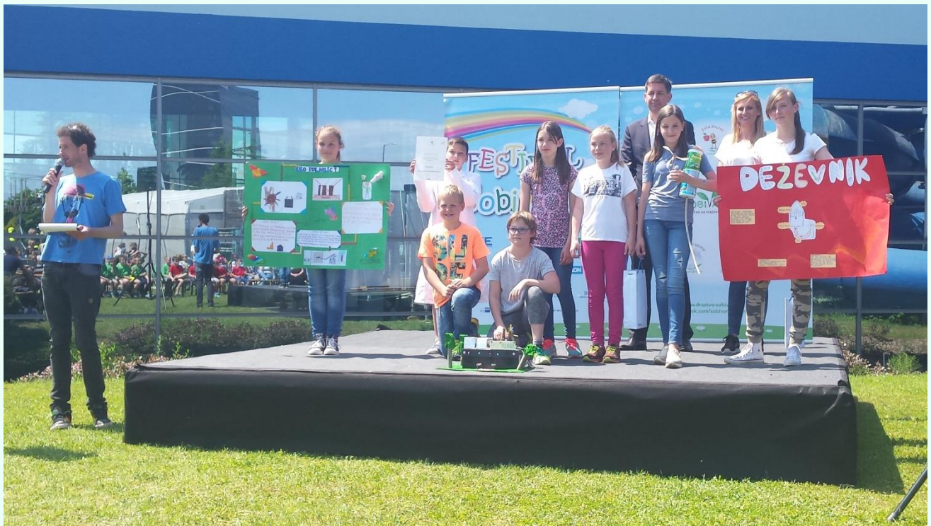
Ob prejetju priznanja in nagrade za prejeto 2. mesto.