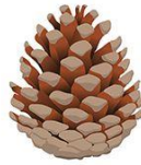
A Pine Cone