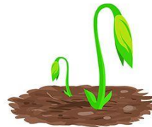
Plants Poking Through The Soil