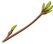
Buds On A Tree