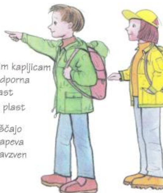
Športna oblačila za vsak dan

proti dežnim kapljicam in vetru odporna zunanja plast notranja plast luknjice dopuščajo znoju, da izhlapeva skozi blago navzven