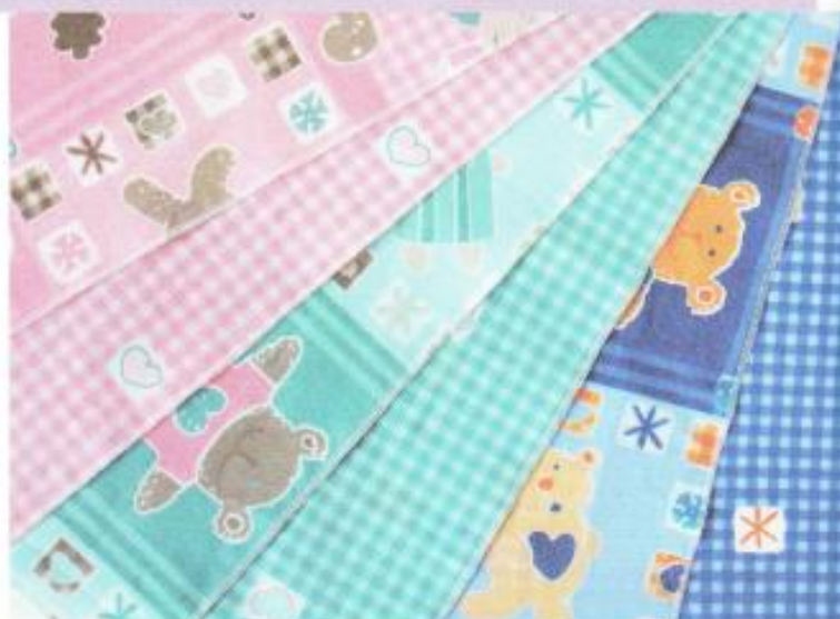
Potiskani vzorci blaga

Blago potiskajo z različnimi vzorci v eni ali več barvah. Tiskajo vsako barvo posebej.