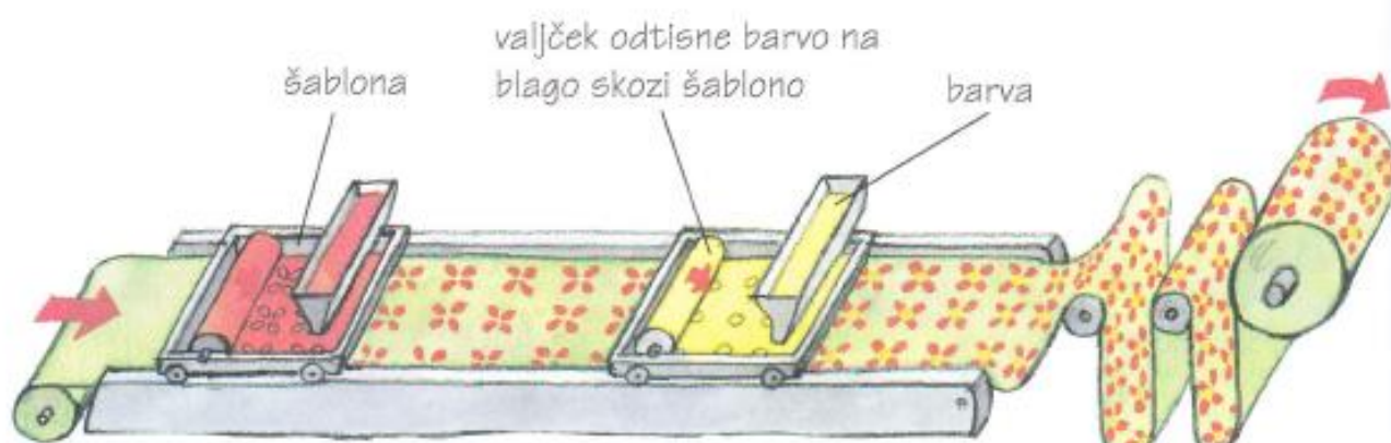
tiskanje 1. barve vzorca