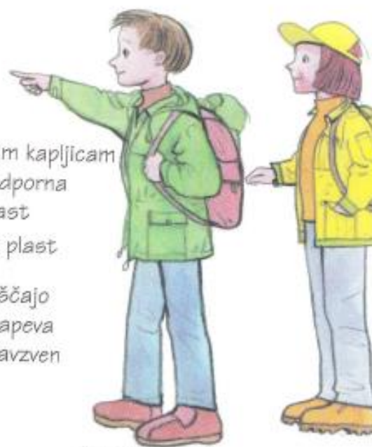
Športna oblačila za vsak dan

Pomembne lastnosti blaga za športna oblačila so vpojnost vlage, zaščita pred vetrom, izhlapevanje znoja. Pri apretiranju blaga nanesejo na njegovo površino snovi, ki v blagu ohranijo majhne luknjice. Te omogočajo izhlapevanje zelo majhnih kapljic znoja, ne prepuščajo pa večjih dežnih kapljic s površine v notranjost blaga.